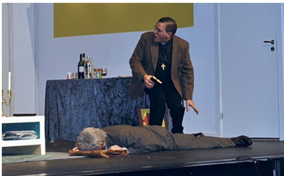
Politikern, alias Gummi-Gunnar, somnar överallt och prästen skyttar ljuset i pärlporten.

Som sig bör fars det ut och in genom dörrar i olika förvecklingar, vilket är det speciella som kännetecknar en fars. Men det handlar inte om att se ljuset i tunneln, snarare om att i en modern version undvika att få ljuset i rumpan.