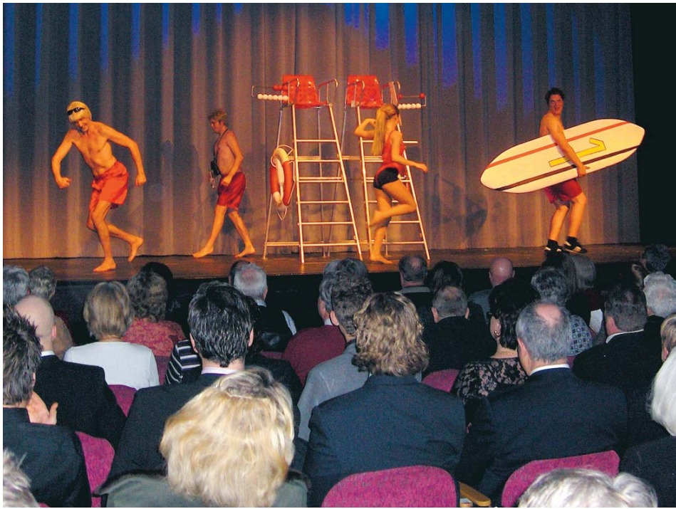
Det är alltid en ynnest att få bli road på hemmaplan. Åkersbergarevyns uppsättning "Nyladdat" har ny regissör och koreograf samt ny producentgrupp. De bjuder på tvära kast mellan skritt och ljuv musik.

För den 27:e gången visar Åkersbergarevyn att de fortfarande kan leverera underhållning med bredd. Sången, dansen och den burleska humorn får en att glömma teaterns obekväma stolar. Till dem som aldrig sett en revy i Åkersberga kan jag bara säga - stackars er. Åkersberga är nämligen rikskänt inom revysammanhang då de kammat hem vinster i Revy-SM.