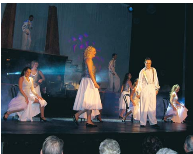
Många av numren i Åkersbergarevyn är skrivna av ensemblens medlemmar. De har lyckats få med X-bussar, arga och rockiga PRO:are, smurfar och badvakter i sin uppsättning av Nyladdat. Proffsiga dansnummer av baletten vävdes naturligt in i handlingen.